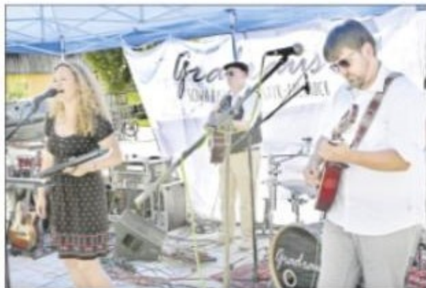
Das waren noch Zeiten: Im Juli 2017 spielte Gradraus beim Jubiläumfest der Welzheimer Zeitung zum 150-jährigen Bestehen auf dem Altdorfer Marktplatz.

das „Wir“ in dieser Gesellschaft ist, die von Eigentrieb und mangelhafter Kommunikation geprägt ist.