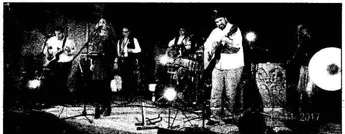
Gradraus in der Bartholomäuskirche